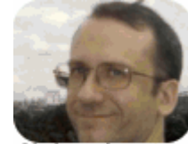
Christophe HEDE e-mail site

Enfin et Moteurzine d'un côté, Développement et Référencement d'un autre.